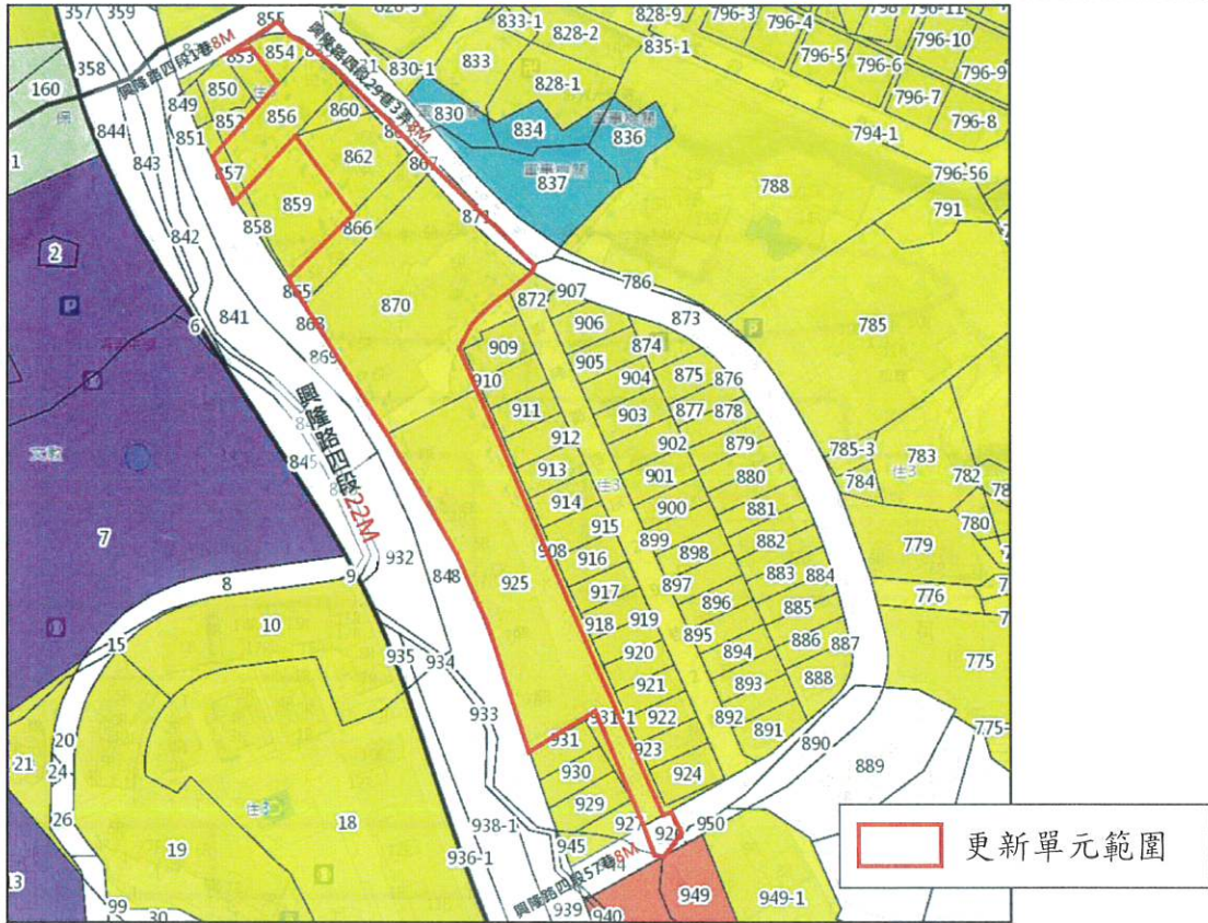
圖 1 本更新單元範圍圖